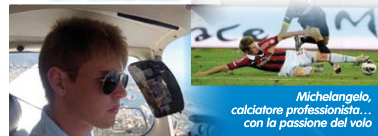
Michelangelo, calciatore professionista... con la passione del volo