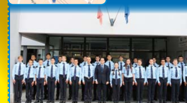
Allievi del primo anno 2018/2019 - Varese - corso Aquila

Prepariamo nuove figure per il mondo del lavoro