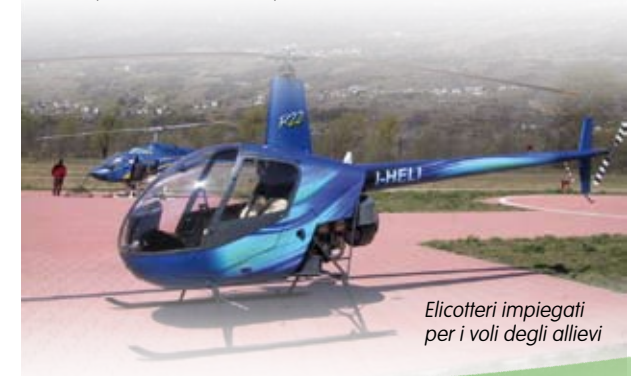
Elicotteri impiegati per i voli degli allievi